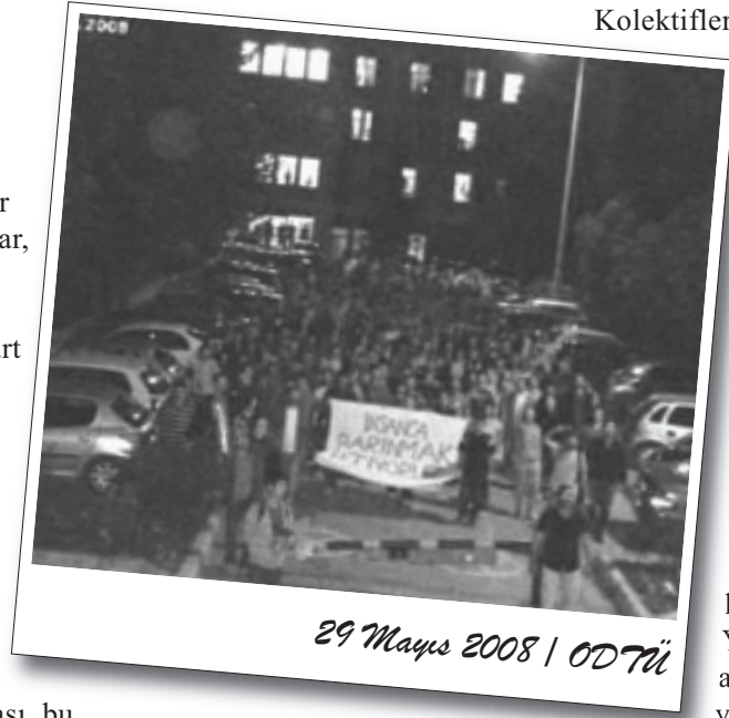
29 Mayıs 2008 | ODTÜ

Muhalefeti eylemde belirleyici oldular. Toplantılarda alınan kararları uygulamamaları, dağınkılığa karşı alınacak önlemlerdeki yetersizlik ile eyleme kendi rengini verme tavrı eylemin zayıf kalmasına yolaçtı. Dağınkılığın ardından yaklaşık 100 kişiyle yurtlar gezildi. Yaşanan dağılmanın ardından eylem yeniden toparlanamadı.